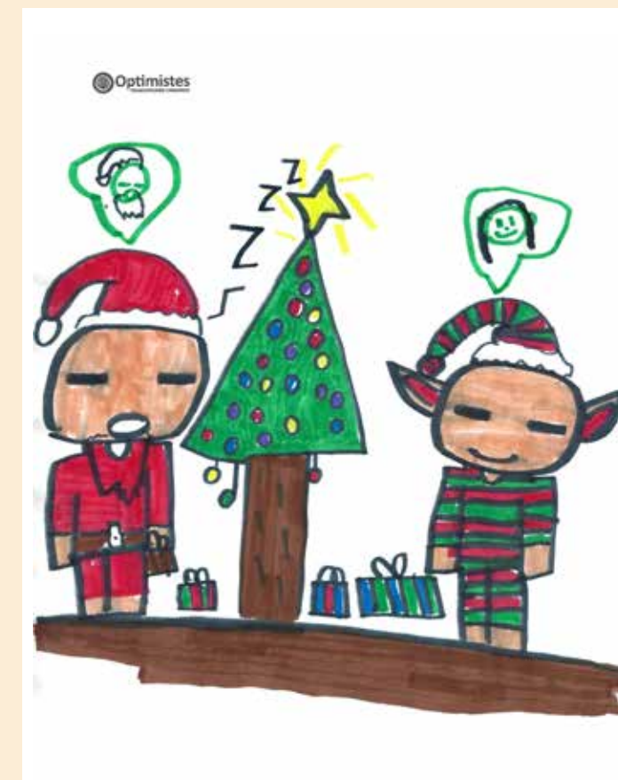
Dessin d'April Beaudoin, gagnante du concours de dessins 2024 organisé par le Club Optimiste de Saint-Paul

En terminant, je transmets mes vœux les plus sincères de bonheur et de santé à tous les Paulois et Pauloises pour la période des Fêtes et la nouvelle année 2025. Au nom de tous les membres du conseil municipal et des employés municipaux, nous vous souhaitons un joyeux Noël et une bonne année 2025!