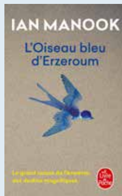
Ruth Veillet L'Oiseau bleu d'Erzeroum Ian Manook